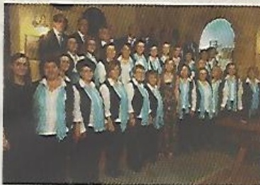
Η χορωδία Μελίτζα Δήμου Παραλιμνίου