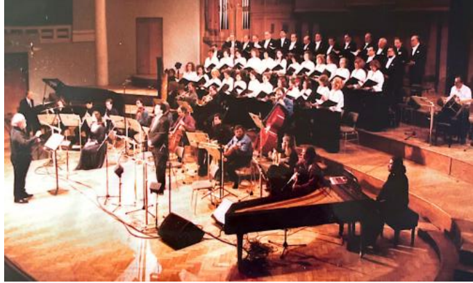
Συναυλία με έργο και διεύθυνση από τον Γιάννη Μαρκόπουλο