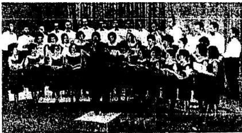
Ἡ χορωδία τοῦ «ΑΡΗΣ» Λεμεσοῦ σὲ ἓνα χαρακτηριστικὸ στιγμιότυπο.