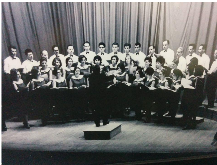
Πρώτη επίσημη συναυλία της χορωδίας μετά την επανίδρυση της το 1962 στο θέατρο Ριάλτο.

Η πρώτη επίσημη συναυλία της χορωδίας «Άρη» Λεμεσού μετά την επανίδρυση της ήταν το 1962 στο θέατρο Ριάλτο στη Λεμεσό και η πρώτη της συναυλία στο εξωτερικό έγινε το 1974 στην Αθήνα στο Φιλολογικό Σύλλογο Παρνασσού (Παλιός χορωδός, 1987).