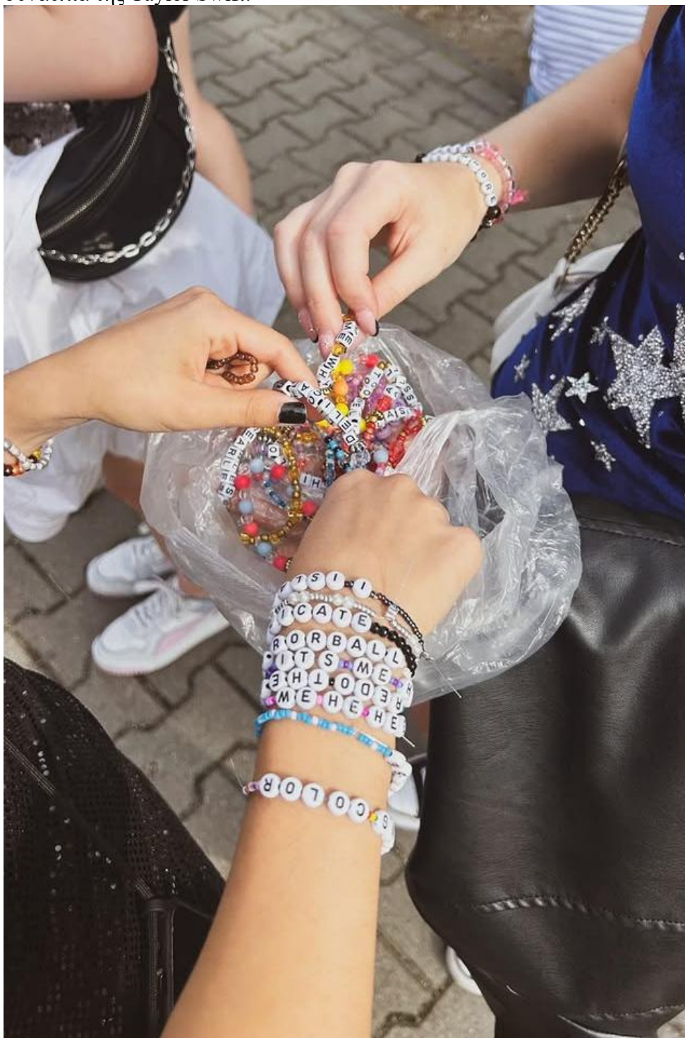
Ανταλλαγή friendship bracelets πριν την συναυλία του The Eras Tour στην Βαρσοβία, Πολωνία.