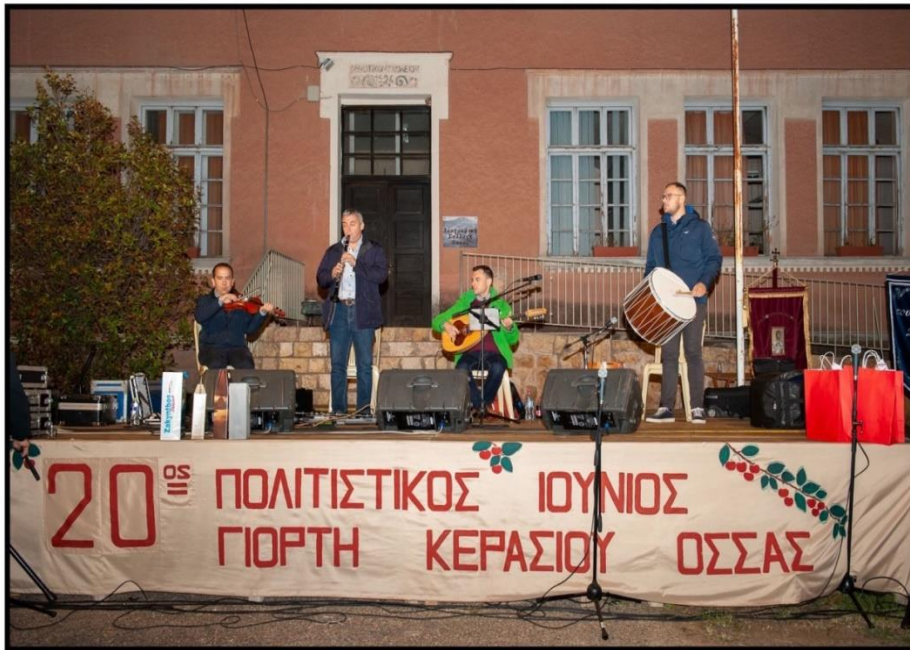
Εικόνα 2.6: Γιορτή Κερασιού στην Όσσα 14

τα τελευταία 22 χρόνια.( εικόνα 2.6). Γνωστό είναι το κτήμα Μπαμπατζιμόπουλου, στις πλαγιές του όρους Βερτίσκου, έκτασης 500 στρεμμάτων, το οποίο διαθέτει σύγχρονο οινοποιείο, κάβα παλαίωσης, αίθουσες γευσιγνωσίας, καφέ και εστιατόριο και οι χώροι δασικής αναψυχής Άη Γιώργης και Κιόσκι. Περιβαλλοντικό ενδιαφέρον παρουσιάζει και η τεχνητή λίμνη Τσισμούρκα. 13