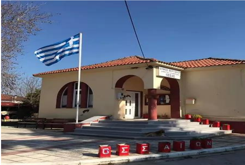
Εικόνα 2.3: Ο σύλλογος Οσσαίων «Η Αγία Κυράννα» 10

Λαογραφική Συλλογή της Όσσας δημιουργήθηκε τον Αύγουστο του 1992 από ομάδα νέων του χωριού με σκοπό τη διάσωση της ιστορίας και της παράδοσης του τόπου. Από το 2016 στεγάζεται σε αίθουσα του διατηρητέου Δημοτικού Σχολείου Όσσας (κτίσμα του 1926) και ο επισκέπτης μπορεί να δει εργαλεία από την καθημερινή ζωή των κατοίκων (αγροτικά, υποδηματοποιίας και τσαγκαρικής), φωτογραφίες, υφαντά κ.α.