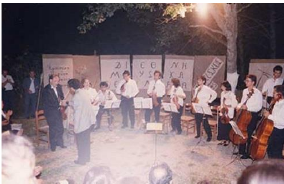
Εικόνα 3.3: Δραστηριότητα της Κατασκήνωσης 21

Μία από τις σημαντικότερες δραστηριότητες στο Βερίσκο ήταν η Κατασκήνωσή του, μια υγιής επιχείρηση που λειτούργησε για πάνω από 23 χρόνια (1983 – 2006). Χιλιάδες κατασκηνωτές από τη χώρα μας και από άλλες χώρες της Ευρώπης φιλοξενήθηκαν, ενώ υλοποιήθηκαν πρωτοποριακά προγράμματα: Αγγλόφωνα τμήματα (1984 – 1995), Διεθνή Μουσικά Σεμινάρια, προγράμματα για άτομα με ειδικές ανάγκες, αθλητικές – καλλιτεχνικές και εκπαιδευτικές συναντήσεις. Από τον Ιούλιο του 2002 η Δημοτική Κατασκήνωση ανακηρύχθηκε επίσημα από το Υπουργείο Παιδείας ως Κέντρο Περιβαλλοντικής Εκπαίδευσης. 20