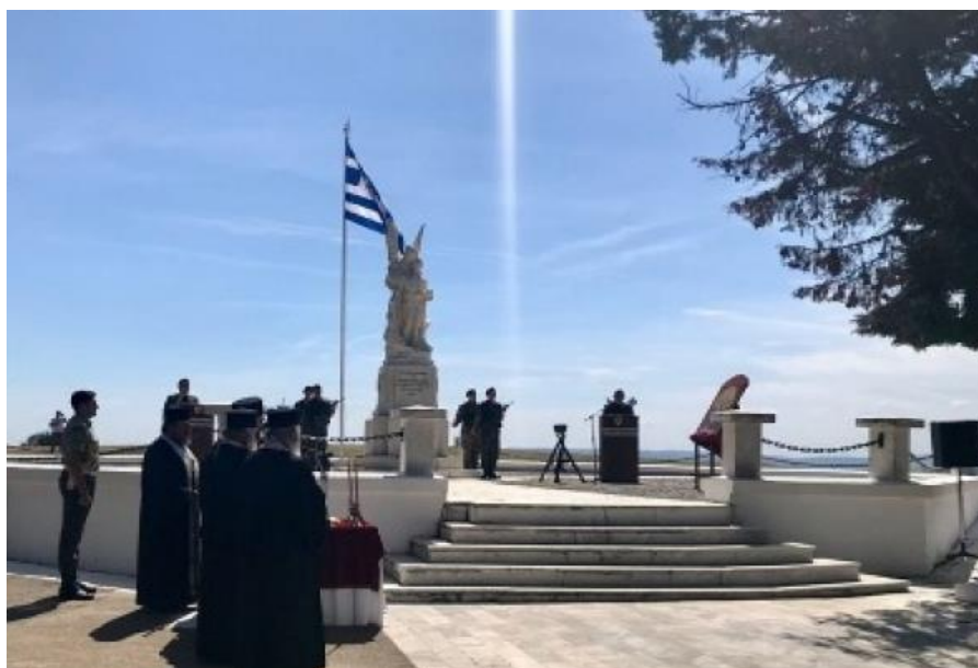
Εικόνα 3.2: Ηρώο Πεσόντων της κοινότητας Βερτίσκου 19