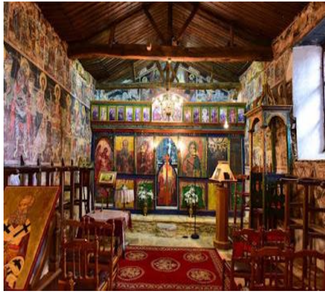
Εικόνα 4.4: Το εσωτερικό του Βυζαντινού Ναού 25