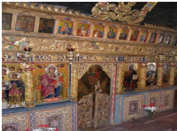
Εικόνα 2.2: Το των Ταξιαρχών