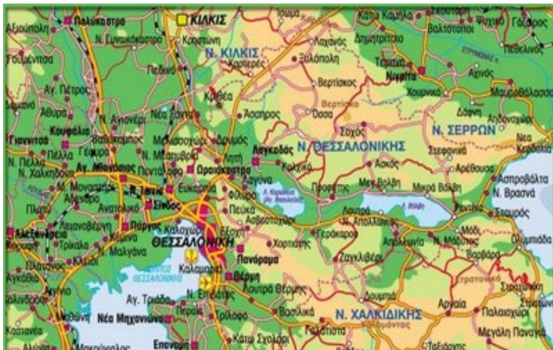
Εικόνα 1: Χάρτης του νομού Θεσσαλονίκης 1

Συμπεραίνουμε λοιπόν ότι είναι αδιαμφισβήτητη η σημασία και η χρησιμότητα της επιτόπιας έρευνας για τη μαγνητοφώνηση και διάσωση του δημοτικού τραγουδιού αλλά και της προσπάθειας που γίνεται για την αρχειοθέτησή της.