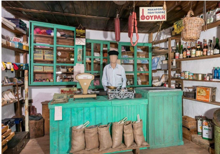
Εικόνα 2.4: Το Παλιό Παντοπωλείο