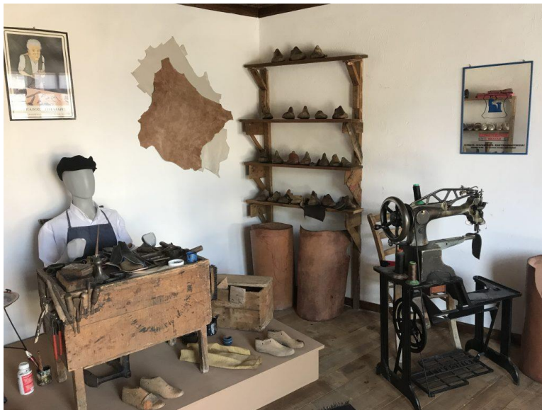
Εικόνα 2.5: Το Παλιό Τσαγκαράδικο. 12

Η Όσσα, εκτός από ένα όμορφο, παραδοσιακό και γραφικό χωριό, διαθέτει και πλούσια γεωργική και κτηνοτροφική παραγωγή, με κυρίαρχη την παραγωγή υψηλής ποιότητας κερασιών και κρασιών. Με αφορμή την παραγωγή κερασιών ο τοπικός Σύλλογος οργανώνει κάθε χρόνο στα τέλη Ιουνίου τις εκδηλώσεις της «Γιορτής Κερασιού», που έχουν γίνει θεσμός