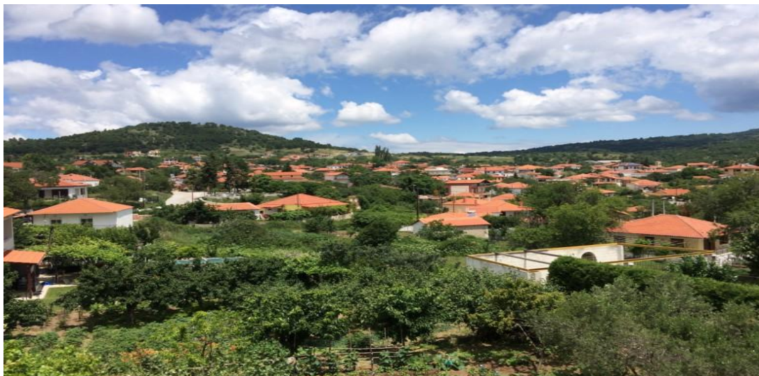
Εικόνα 2: Φωτογραφία από το χωριό Όσσα 2