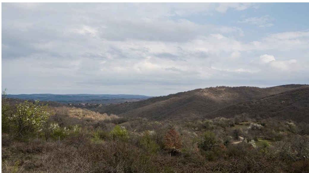
Εικόνα 4.1: Φωτογραφία της Χωρούδας 23