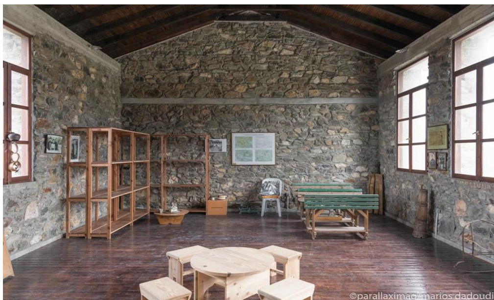
Εικόνα 4.2: Το εσωτερικό του ανακαινισμένου σχολείου της Χωρούδας 24

Στην είσοδο του χωριού συναντά κανείς το πετρόχτιστο σχολείο της Χωρούδας, το οποίο κατασκευάστηκε το 1932 και λειτούργησε μέχρι την κατάργηση του οικισμού. Σήμερα, μετά την αποκατάστασή του λειτουργεί ως κτίριο μνήμης και παράδοσης.