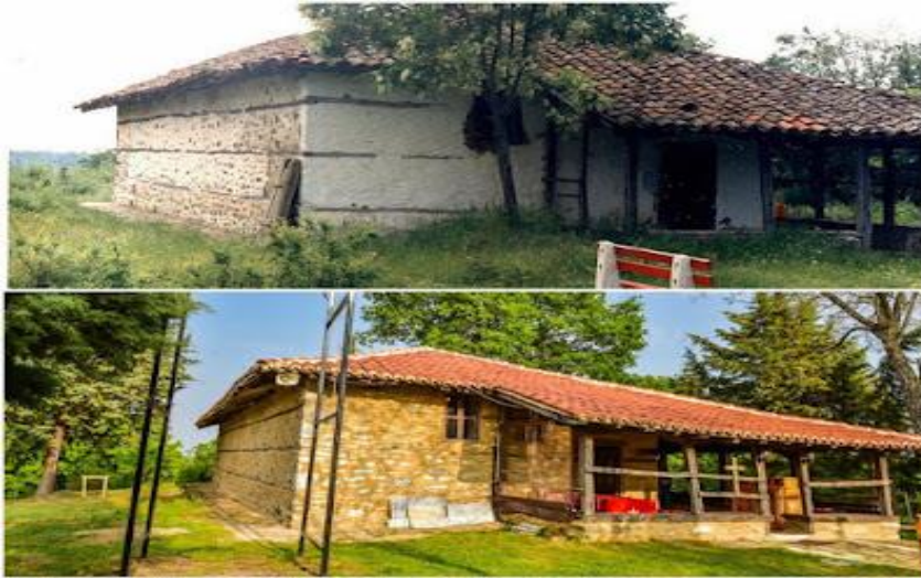
Εικόνα 4.3: Ο Ναός Αγίου Αθανασίου Χωρούδας πριν και μετά την ανακαίνιση