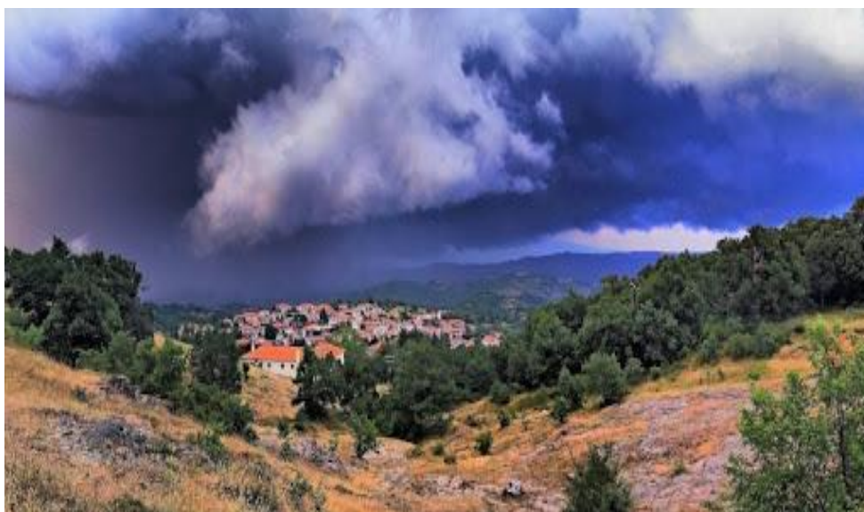
Εικόνα 3.1: Φωτογραφία από το χωριό Βερτίσκος 16