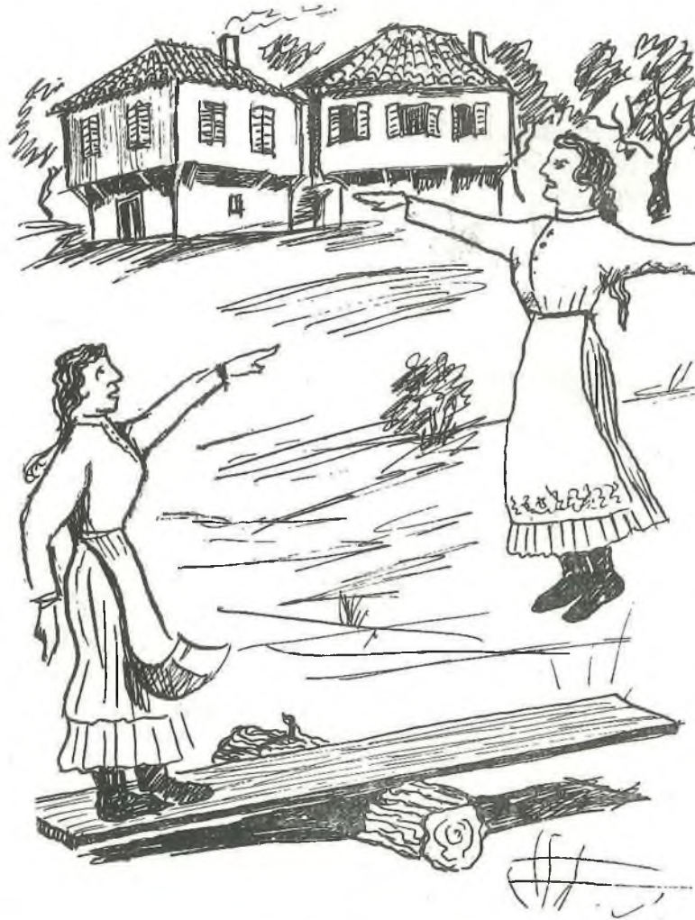
Ἡ Ζούβελη (Παιδιαὶ κορασίδων Σαμμακοβίου).

εὐχή. Δὲν ὑπῆρχε περίπτωσηὶ στὴ ζωὴ τους ποὺ νὰ μὴν εὐχηθοῦν, εἴτε ἀπὸ εὐγνωμοσύνη εἴτε ἀπὸ χαρὰ σὲ γάμους, σὲ βαφτίσια, σὲ νιορτές, εἴτε γιατί πίστευαν δλόψυχα στὶς εὐχές. Καθε μικρότερος προσπαθοῖσε νὰ κάμη κάτι