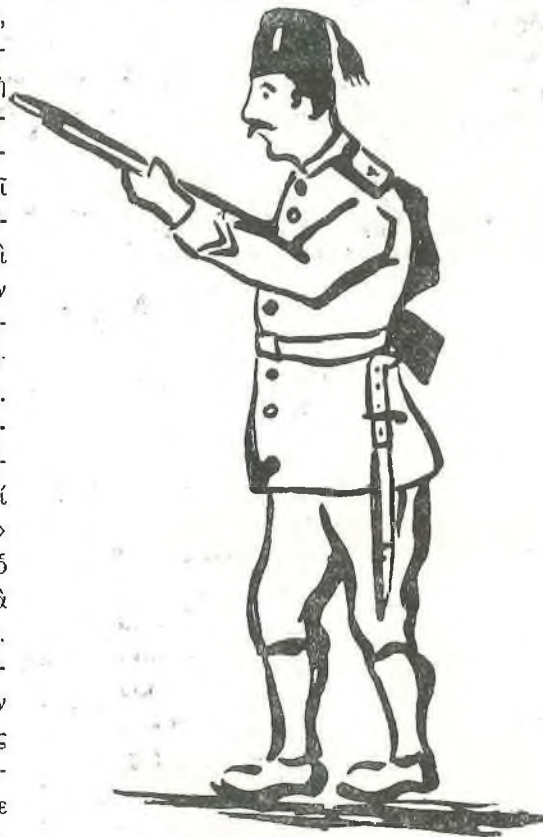
Σακήρ ὁ Ὀμπασης, γνωστὸς εἰς τοὺς Σαμμακοβίτες