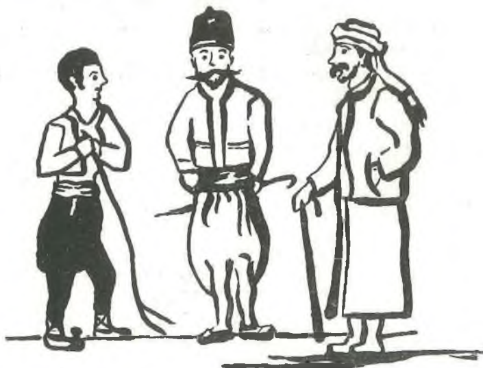
Τύποι Σαμμακοβιτῶν (1880).

Τὰ παιδιά σὰν ἔβγαζαν τοὺς γαλακτόδοντας, τοὺς πετοῦσαν στὰ κερα-