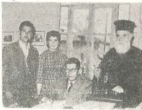
Φωτογραφίαι από τήν προικοδότησιν τῆς Χαρ Ἰουτσαγγελᾶ.