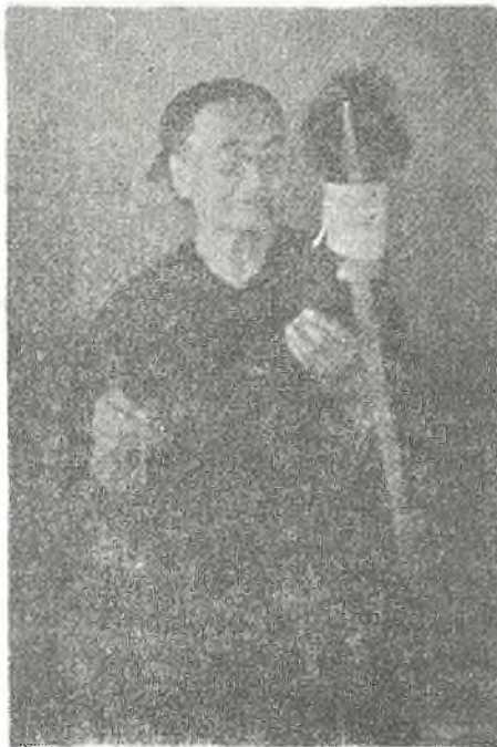
Τύπος Σαμμακοβιανῆς γυναίκας.

Ἐυλοκόπος πού ἔκοβε γέρικο δένδρο, στὸ μέρος τοῦ δένδρου πού ἔμενε στὴ γῆ, χάραζε σταυρὸ. Κι' ὅποιος ἔσπερνε καρυδιά, ἐπίστευαν πὼς αὐτὸς